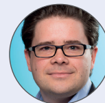
Felix Schumann Unitymedia NRW GmbH