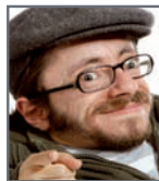
Raúl Krauthausen SOZIALHELD Wegbereiter & Gründer des Wiki-Projektes Wheelmap.org